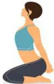
COW STRECH SENTADO