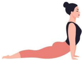
PERRO BOCA ARRIBA