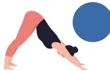
PERRO BOCA ABAJO